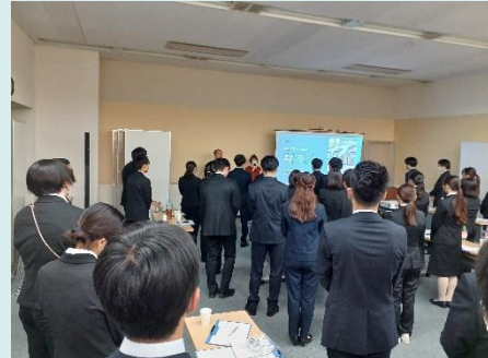
ポスターセッションと交流会の様子